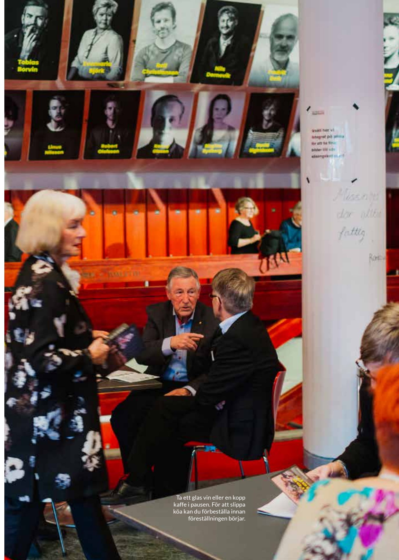
Ta ett glas vin eller en kopp kaffe i pausen. För att slippa köa kan du förbeställa innan föreställningen börjar.

SER MEST FRAM EMOT: Jeanne d'Arc. Det är alltid intressant med en pjäs som är baserad på en sann historia. Dessutom är det mycket bra skådespelare!