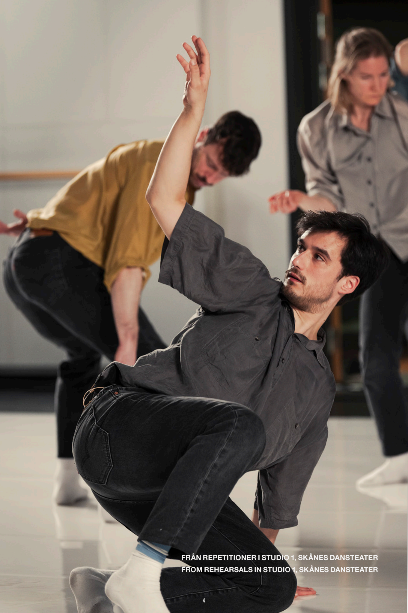
FRÅN REPETITIONER I STUDIO 1, SKÅNES DANSTEATER FROM REHEARSALS IN STUDIO 1, SKÅNES DANSTEATER