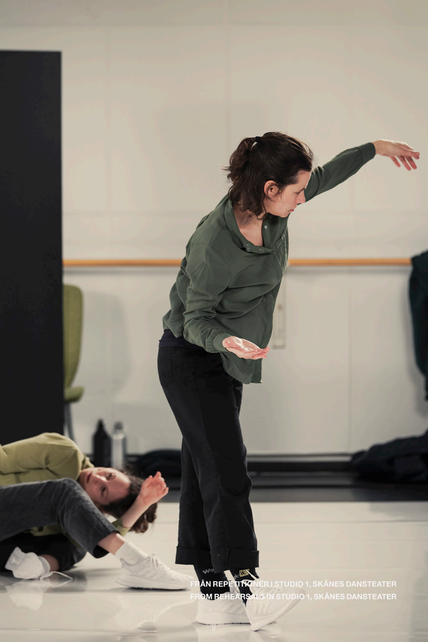
FRÅN REPETITIONER I STUDIO 1, SKÅNES DANSTEATER FROM REHEARSALS IN STUDIO 1, SKÅNES DANSTEATER