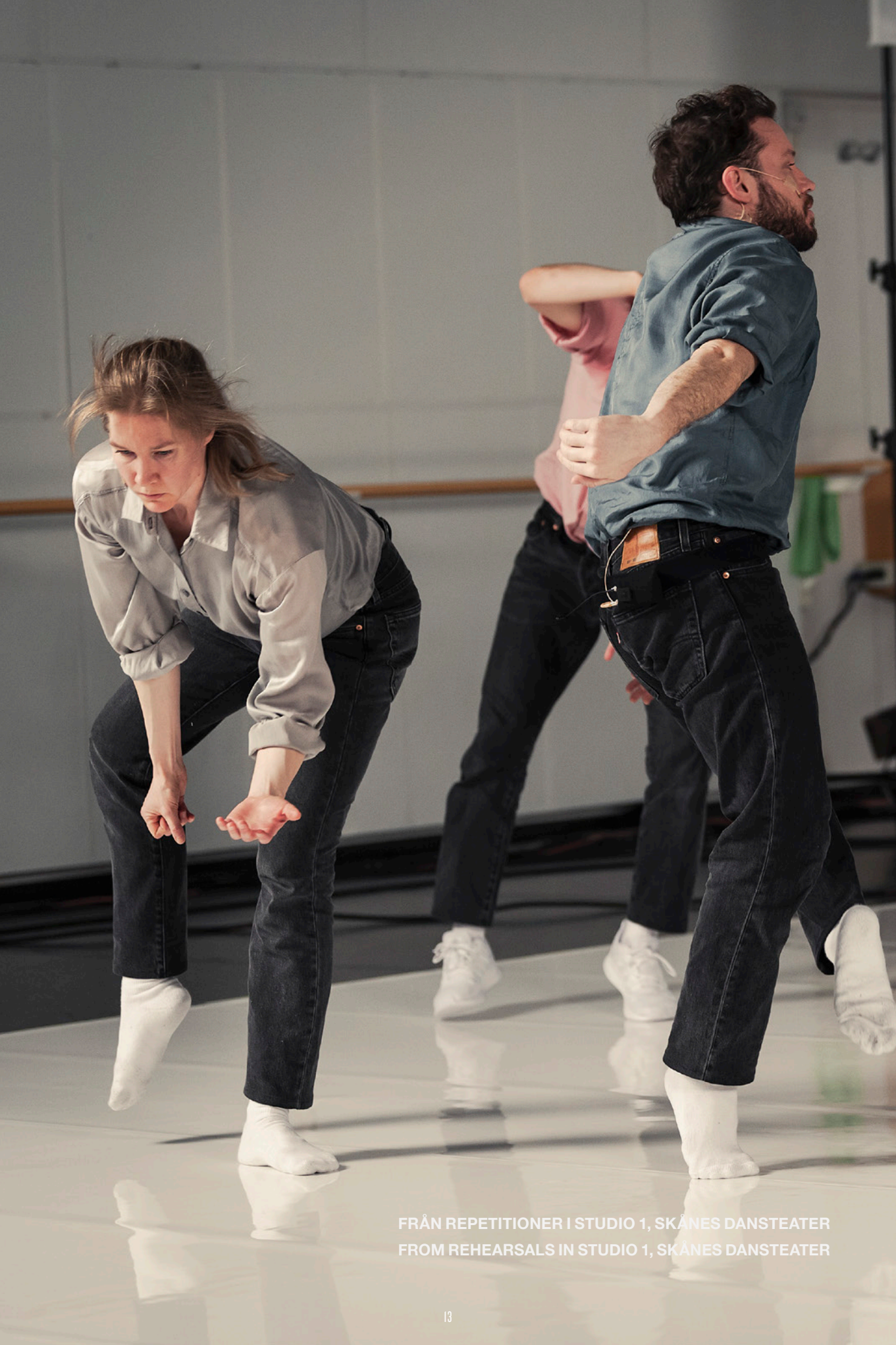
FRÅN REPETITIONER I STUDIO 1, SKÅNES DANSTEATER FROM REHEARSALS IN STUDIO 1, SKÅNES DANSTEATER