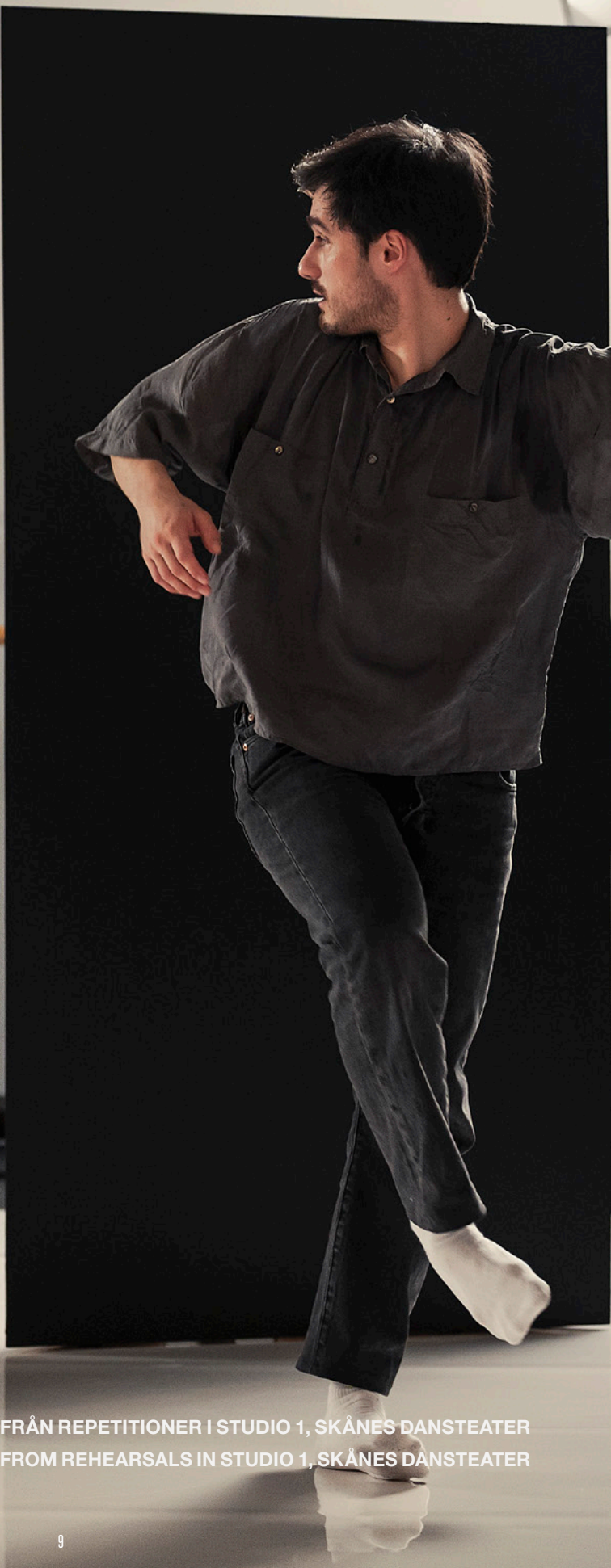
FRÅN REPETITIONER I STUDIO 1, SKÅNES DANSTEATER FROM REHEARSALS IN STUDIO 1, SKÅNES DANSTEATER