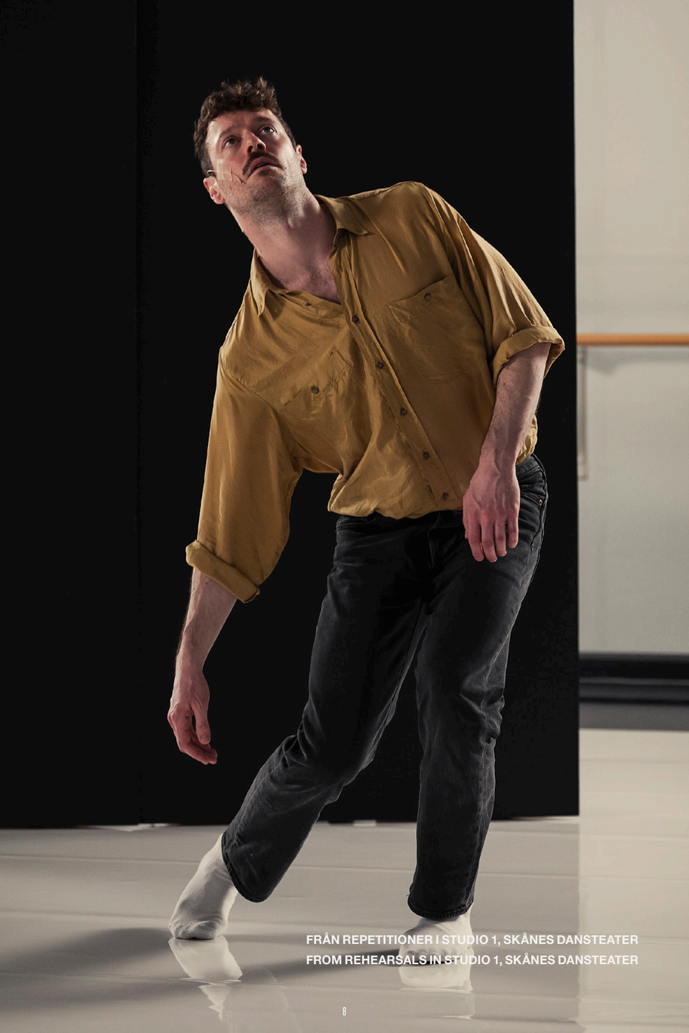
FRÅN REPETITIONER I STUDIO 1, SKÅNES DANSTEATER FROM REHEARSALS IN STUDIO 1, SKÅNES DANSTEATER